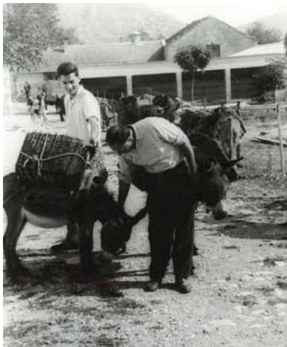
Slika 1. Prijevoz grožđa na magarcima

Ipak, nakon osmanlijske okupacije Bosne i Hercegovine vinogradarstvo počinje stagnirati na cijelom prostoru, a u nekim krajevima i rapidno opadati. Glavni su razlozi za takav trend islamizacija stanovništva i smanjena potrošnja alkohola, te nestanak kršćanskog stanovništva koje je uzgajalo vinovu lozu i konzumiralo vino (Beljo i sur., 2018). S druge strane, Austrougarska je vlast odmah nakon okupacije ovih prostora počela poduzimati mjere u pogledu revitalizacije vinogradarstva i stimulacije proizvodnje vina. Poduzela je niz aktivnosti kako bi se povećale površine pod vinogradima i kako bi se pospješila proizvodnja grožđa i prerada vina. Sukladno tomu osnivanju se voćarsko-vinarske stanice, formiraju se lozni rasadnici, vrši se evidentiranje i deskripcija najvažnijih hercegovačkih kultivara vinove loze, otvaraju se pokusni vinski podrumi, stimulira se osnivanje privatnih vinskih podruma u gradu Mostaru, lokalni vinari šalju se na obuku i školovanje u vinogradarsku školu u Klosterneuburgu kod Beča, poduzimaju se mjere za sprječavanje pojave filoksere u Bosni i Hercegovini i dr. Sve pobrojano utjecalo je na progresivan razvoj vinogradarstva i vinarstva u Hercegovini koja je koncem austrougarske vladavine imala 6.040 ha pod vinovom lozom i koja je 1912. godine proizvela čak 120.800 hl vina. Bitno je naglasiti i kako je Austrougarska izgradnjom prometnica pridonijela povećanoj trgovini vinom jer se u to doba transport roba uglavnom obavljao tovarnim konjima i mazgama.