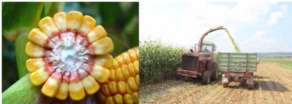
Slika 3. Siliranje kukuruza u sušnim godinama treba započeti najkasnije do stadija 50 % mliječne crte.

Svima je poznato da u proizvodnji silažne mase tehnološka zrelost kukuruza nastupa nešto ranije nego što se potpuno izgradi prinos zrna i postigne najveća masa suhe tvari biljaka. Vlažnost silirane mase u normalnim vegetacijskim sezonama je usko povezana s vlažnosti zrna tako da vlažnosti silažne mase od oko 65-70% odgovara vlažnost nezrelog zrna od oko 35-40% . Prema tome, skidanje cijelih biljaka za proizvodnju silaže obavlja se kad zrno ima navedenu vlažnost, a to se najčešće određuje prema položaju mliječne crte na zrnu (slika 3).